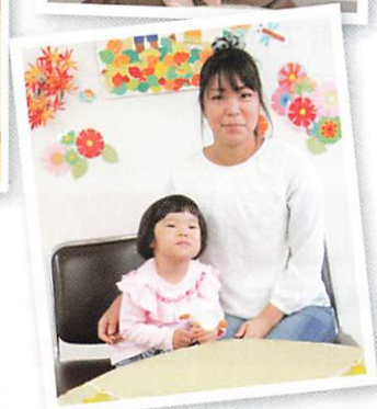
撮影コーナーの様子